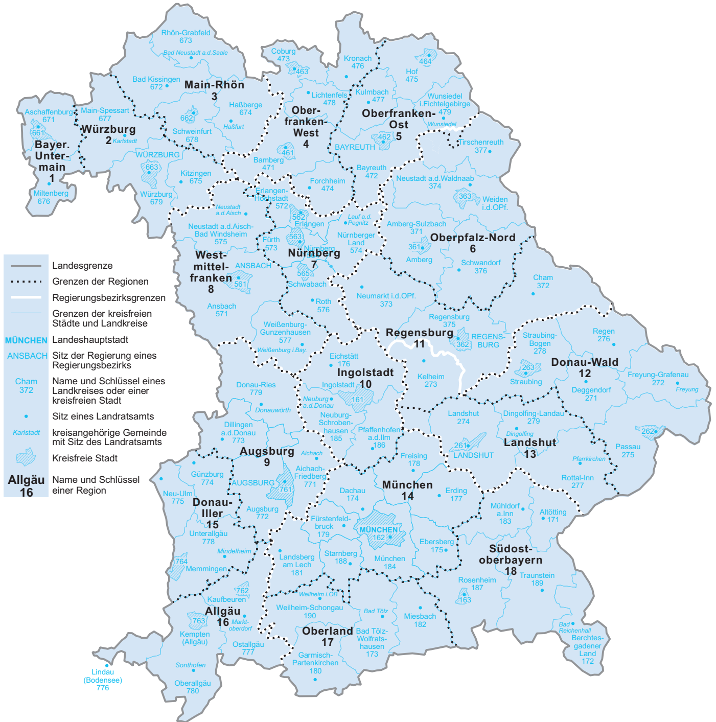
Abb. 2 Regionen Freistaat Bayern Stand: 31. Dezember 2014